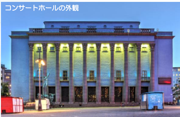
コンサートホールの外観

ストックホルム コンサートホールは1926年に完成し、スウェーデンを代表する音楽文化の中心として長く親しまれ、2026年の本年は200年の節目の年を迎えます。青い外観と新古典主義様式の優雅な建築で知られ、毎年12月に行われるノーベル賞授賞式の会場としても世界的に有名です。